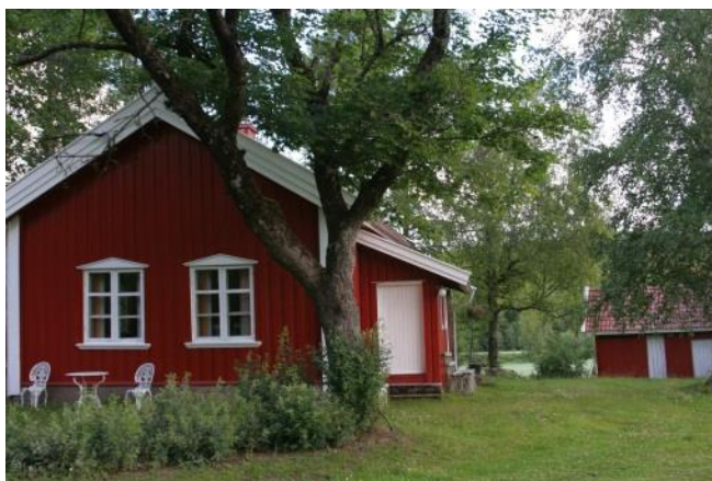
Trosterud skolemuseum

Sommer sol og glede kan du se det og har du en plage som volder det ubehage' i din mage at du må klage så legg deg på sinne helt der inne at du får det du sår og går det bra så si det da det gjør deg og andre gla' Jon Riiser