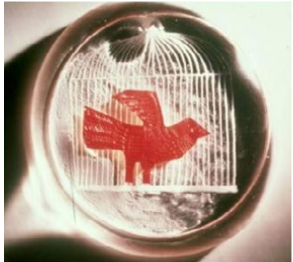
Fugl i glass. Foto: Anders Lindaas 2014

lang, og besværlig med de tunge bakker. To sund måtte passeres, og presten måtte overnatte i anneksgården.