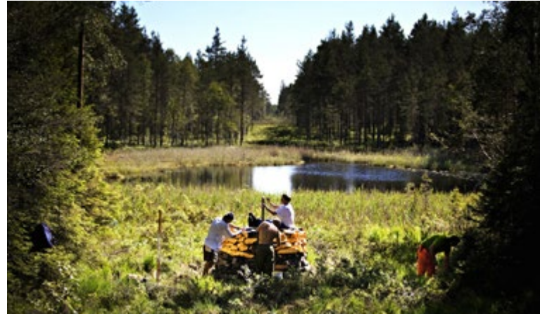
Vedlikehold av grenserøys.

For det var langt mellom røysene, oppmålingene var unøyaktige og derfor er grensen justert mange ganger siden. Selv i dag blir unøyaktige målinger oppdaget. Langs grensen til Sverige har Rømskog grenserøys fra nummer 40 (Langevannet) til nummer 52 (Hvitsjøen).