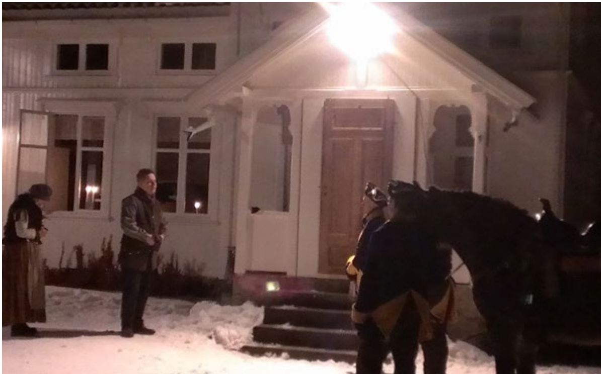
Lokalt spill. Fra markeringen av Karl den 12. 8.mars 2016.

Skogen var og er den viktigste naturressurs i Rømskog. Foruten å være jakt- og beitemark, har den fra uminnelige tider gitt råstoff til husbygging, brensel, gjerdefang og never til takteking. Tømmeret fikk ingen større bruksverdi før sagbruksnæringen for alvor gjorde seg gjeldende fra annen halvdel av 1600-tallet. Da var det mulig å fløte tømmer ut til de store vassdrag, og utenbygds trelasthandlere gikk