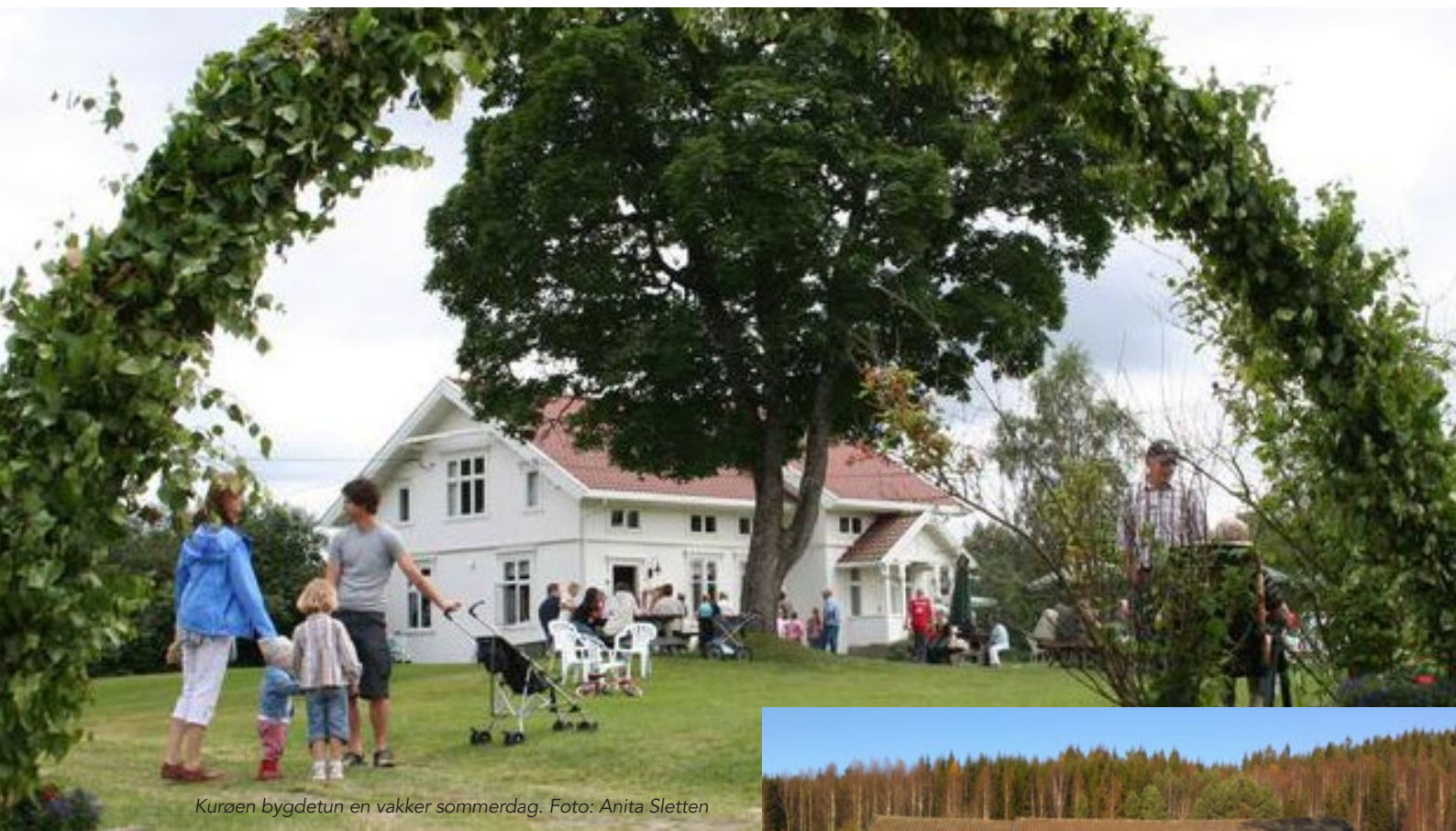
Kurøen bygdetun en vakker sommerdag.