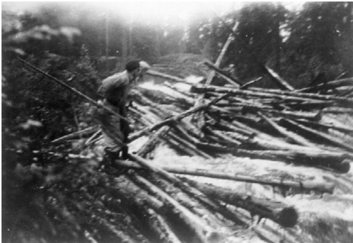
Tømmervase i Ertevassbekken. Med stokklengder på opptil 10 meter på sliptømmeret var det en stor utfordring å fløte tømmeret uten at det ble slike vaser som på bildet. Ertevassbekken og andre bekker var ganske smale og gjorde fløtingen vanskelig. Det hendte ofte man måtte bruke dynamitt til å løse opp i vasene, og det var ikke uvanlig at fløterne fikk seg et ufrivillig bad.

bevisst inn for å skaffe seg råstoffer til sagbruk ved utløpet av elvene.