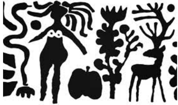
Typisk Lindaasmotiv.

Presteveien er en av de to eldste veiene mellom Rødenes og Rømskog og er avmerket på et kart fra 1799. Denne veistrekningen ble kalt Presteveien fordi presten brukte den når han skulle utføre tjeneste i Rømskog annekskirke. Også lensmannen og andre øvrighetspersoner benyttet denne veien. Den korteste strekningen mellom hovedsognet og Rømskog kirke var om Haukenes anneksgård. Veien var 28 km