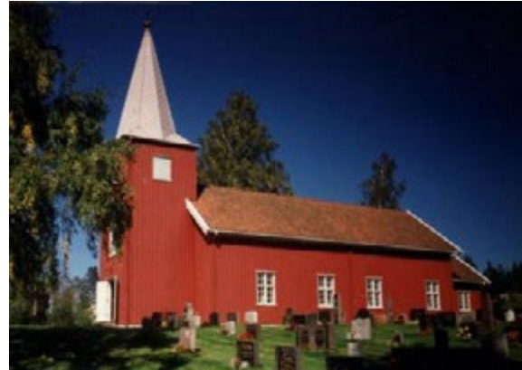
Rømskog kirke.

Dagens kirke har gjennomgått flere ombygginger og fikk sitt nåværende utseende i