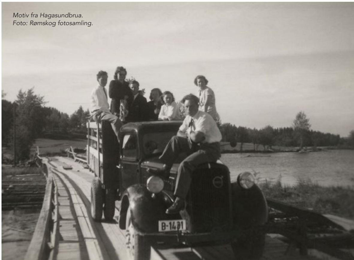
Motiv fra Hagasundbrua.