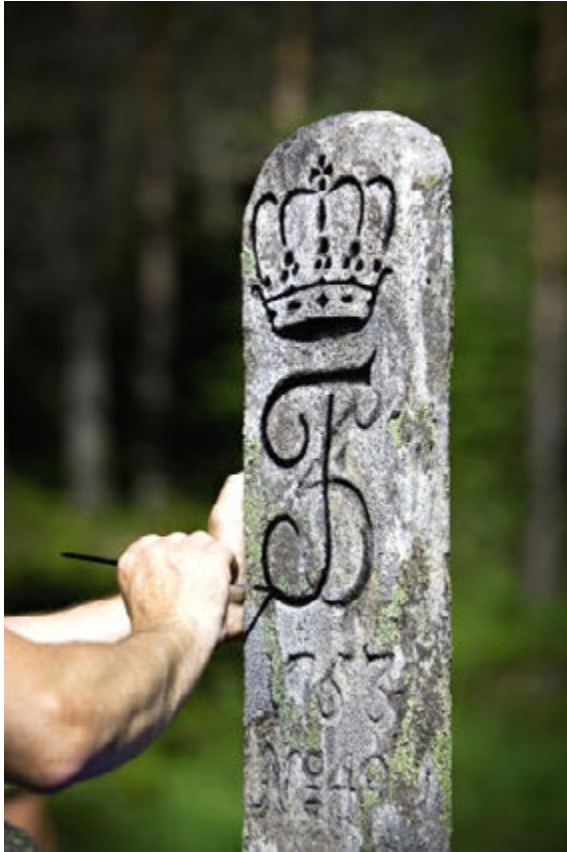
Grenserøys nr. 49 ligger i Trosterud-grenda der fylkesvei 126 går inn i Sverige. Under gjennomgangen av grensa i 1740-åra ble stedet kalt «Sten i Mosehalsen». Vanligvis er røysene runde, men det finnes noen få firkantede i området. Den høye flate steinen ble kalt hjertesteinen, og de to på hver side i samme linje er visersteinene. Når man sikter over disse og hjertesteinen, finner man grensas videre retning nordover. De to andre steinene på flatsiden av hjertesteinen kaltes vitnesteinene, og er vanligvis runde på toppen. Foto: Kjeld Magnussen, 1972.

hvordan riks røys i myr skal fundamenteres og størrelsen på dem (3 alen høye og ni alen i omkrets).