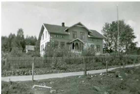
Skjønhaug var et sentralt hus på Vestsida. Her var det butikk i to perioder. De siste varene ble solgt straks etter krigen. I tillegg var det posthus fram til slutten av 1960tallet, og telefonsentral fram til 1973. Bildet er fra 1930.

skog; på Søndre Trandem, på nordre Haukenes og i den gamle tollstasjonen på Trosterud. Kjøpmennene dro med hest til Mysen stasjon for å hente varer.