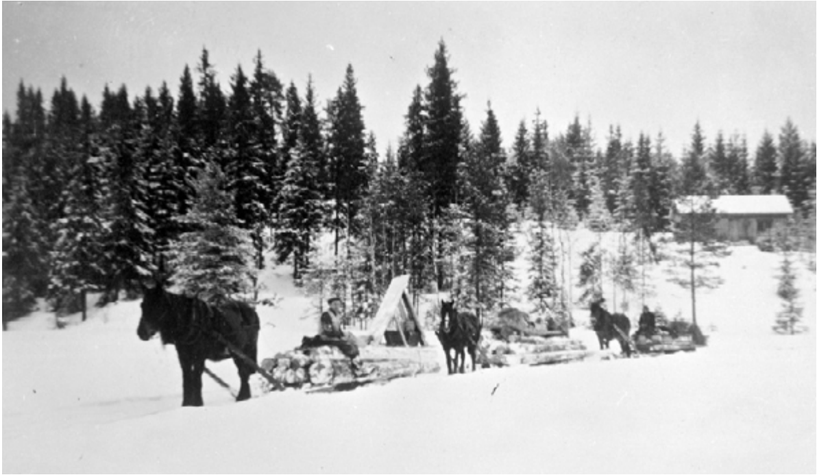
Hester, tømmer på sleder vinterstid.