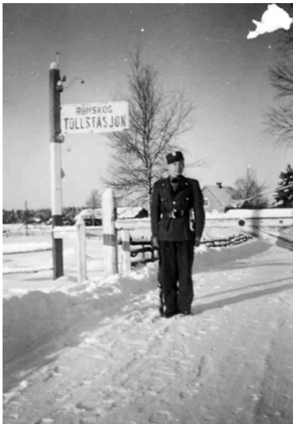
Grensepolitiet, også kalt Grepo, var den suverent største avdeling av Statspolitiet, formelt opprettet høsten 1941 og i funksjon fra januar 1942. Grensepolitiet arbeidet med flyktningesaker, jødespørsmål, falske legitimasjonskort, grenseboerbevis og passersedler. På sitt største, i 1943, talte styrken 183 mann. Eier: Hemming Ringsby.

Hundrevis, trolig over tusen loser, var i tjeneste i kortere eller lengre tid. I rutene fra Oslo kunne noen ganger to fulle lastebiler dra i følge. Av og til ble det brukt drosjer. Ferden stanset ikke før i Rømskog eller i grensebygdene lenger sør. Siste etappe gikk nesten alltid til fots i mørke og i ulendt terreng, og det kunne være strabasøst for gamle, syke, kvinner og barn. Losen gikk foran med ryggsekk og annen oppakning. Han bar kanskje også et barn på ryggen. Spedbarngråt var et problem, og små barn var derfor ikke populære i flyktninggruppene. Som regel fikk de sovemedisin på veien mot Sverige.