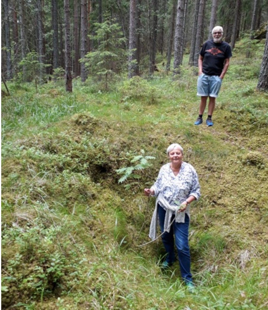
Fangstgrop ved Trosterud. 2017

Trosterud hører trolig til de yngste gårdene i bygda og ble ryddet i seinmiddelalder. Gården lå øde etter svartedauen og ble tatt opp igjen under Flaten på 1600-tallet.