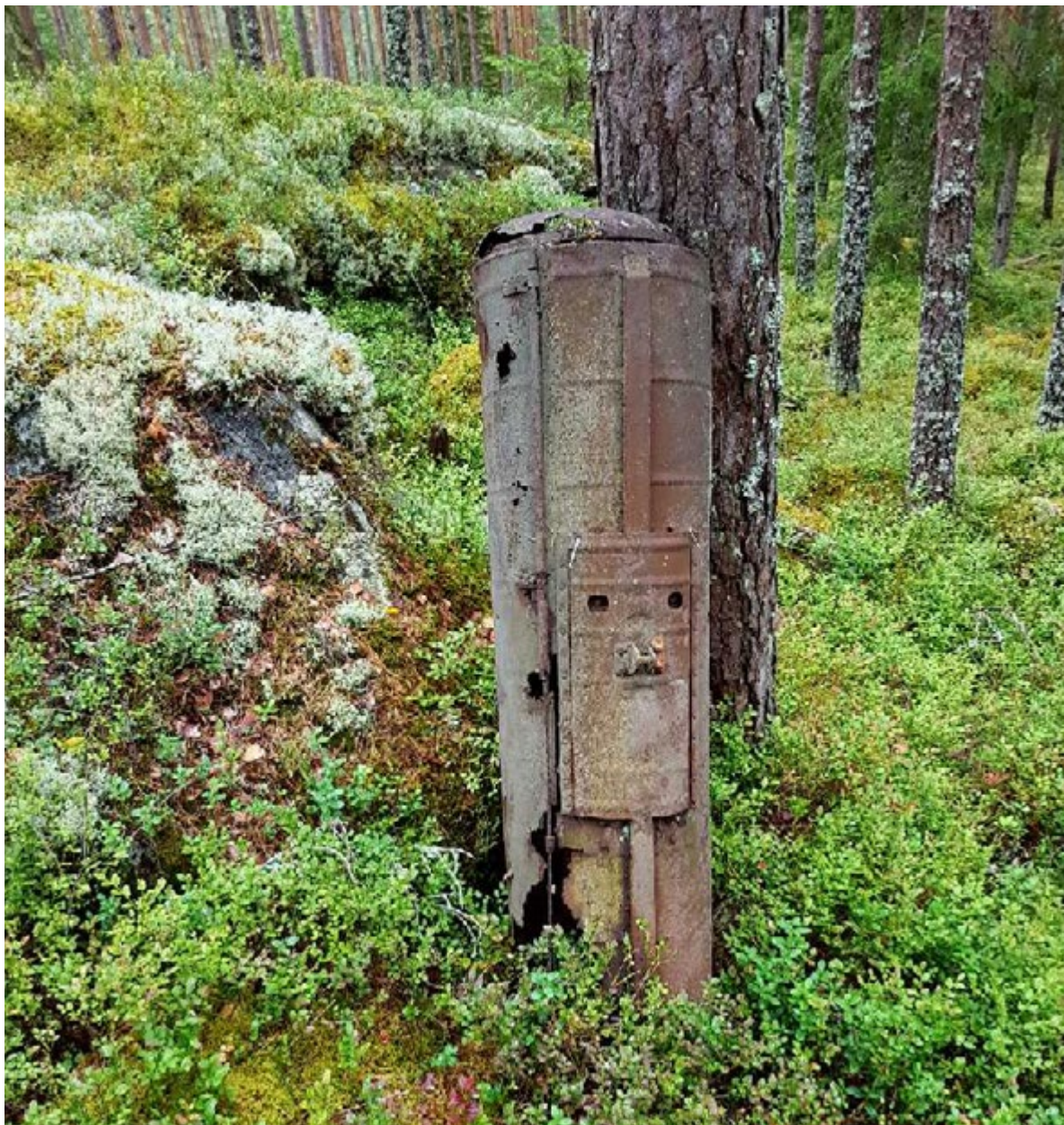
Restene etter en container, som i sin tid inneholdt engelske våpen og utstyr.