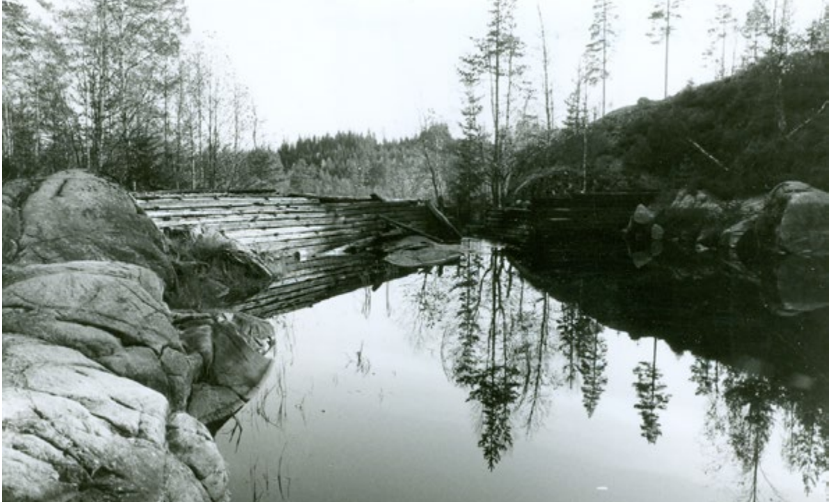
Røvassdammen og flere andre fløytedammer var dobbeltveggede laftedammer fylt med stein. De parallelle veggene var ca. en meter fra hverandre og ble holdt sammen av innlaftede stokker på tvers.