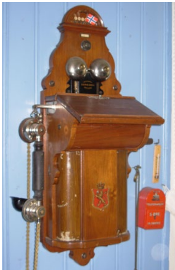
Telefonen kom til Rømskog via Setskog og var ikke i hvermanns eie den første tiden. Gjennom åra frem til automatiseringen i 1979 hadde man to telefonsentraler i Rømskog, en nord i bygda og en sør. De første telefonene var nokså enkle, men etter hvert kom også kunsten til å prege apparatene slik som denne forseggjorte utgaven fra Vestre Bøen.

eget ringesignal, som gikk på antall ganger det ble ringt. Abonentene fikk ringesignal i nummerert rekkefølge.