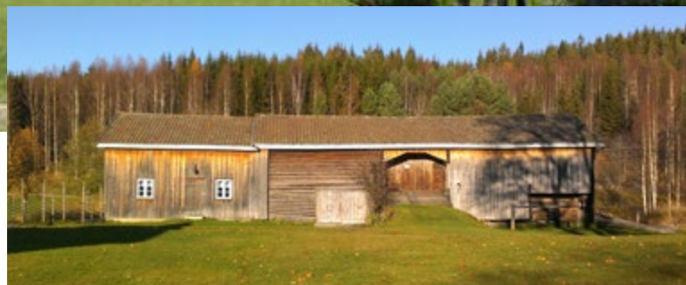
Låven på Kurøen.

Gårdens historie føres tilbake til 1599. Den nåværende våningsbygningen er bygd i 2 etap-