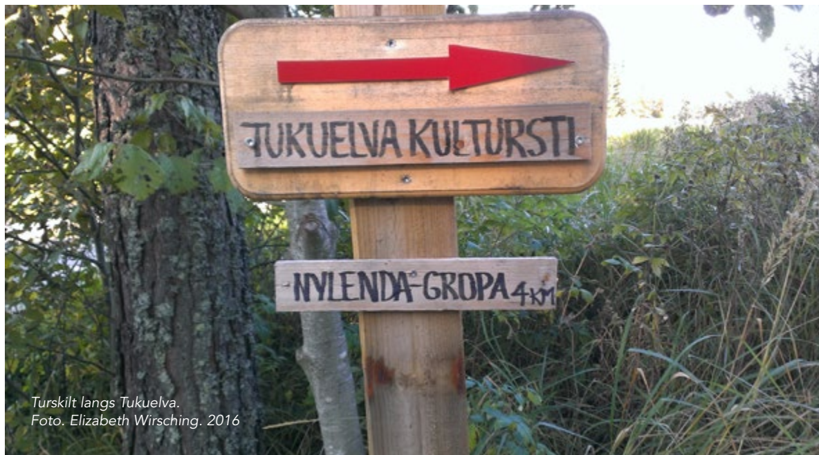
Turskilt langs Tukuelva.

Spor etter den opprinnelige finnebosetningen er ennå så vidt synlig og er oppmålt av fylkeskonservatoren. Det gjenstår ett hus fra bosetningen. Et ytterligere minne om finnene finnes i navnet på en myr i nærheten: Finnemåsan.