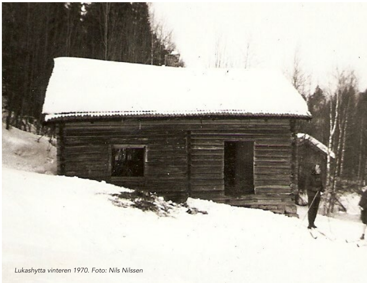
Lukashytta vinteren 1970.

Trandemsætra er nevnt første gang i et skifte på Trandem i 1738. Det er nevnt «en liten husmannsplass» på Trandem i 1680, og dette kan være Trandemsætra