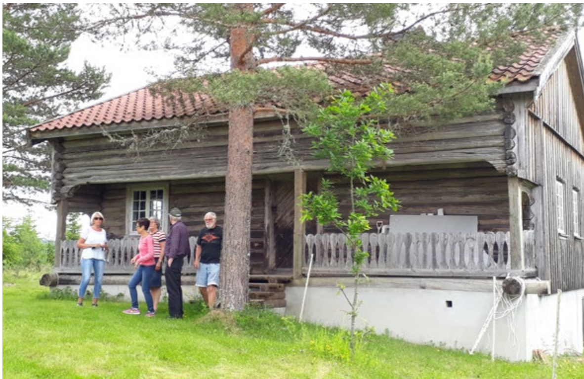
Nord-Flaten stua.

Delet til Trosterud må ha gått langs elva fra Rømsjøen. Det gamle tunet på Flaten kan ha ligget der Flatahaugen har husene. Flaten var i bruk i de vanskelige årene etter svartedauen, mens Nes ble fraflyttet. Flaten ble nå den største gården i denne delen av bygda, og Nes ble en del av Flaten.