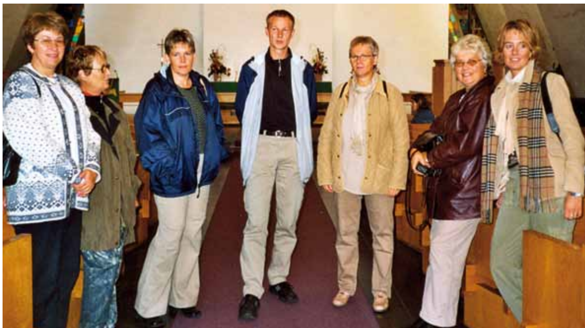
Lærerstaben 2004 på kurs i Tromsø