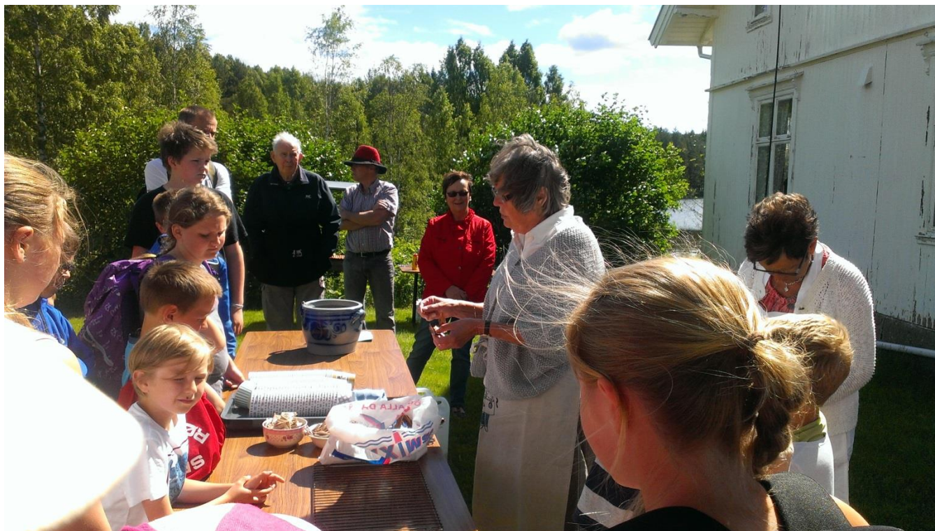
Bilde fra skolens dag på 1814 veien