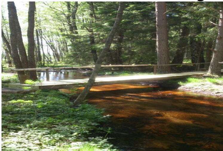
Bilde av 1814 veien

17.5: Fokus på Grunnlovens 200-års jubileum