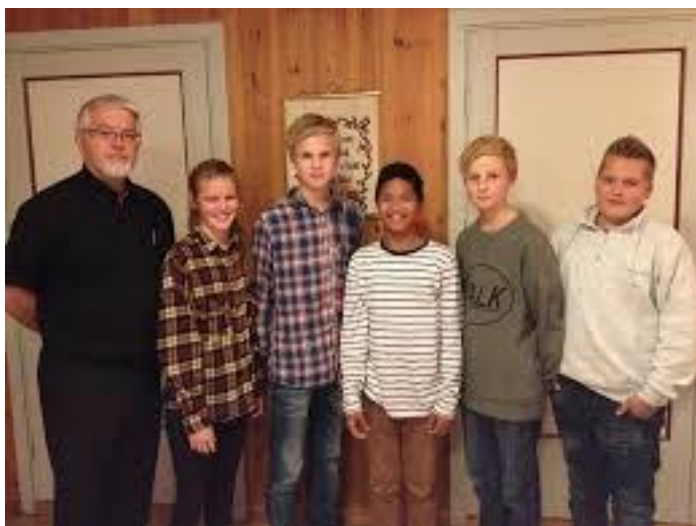
Årets konfirmanter 2013